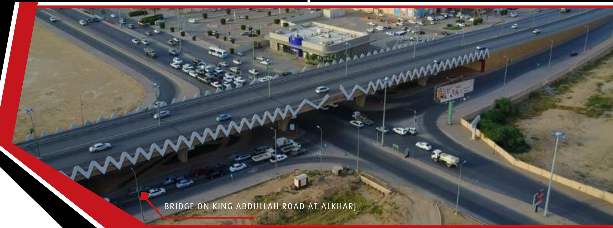
BRIDGE ON KING ABDULLAH ROAD AT ALKHARJ