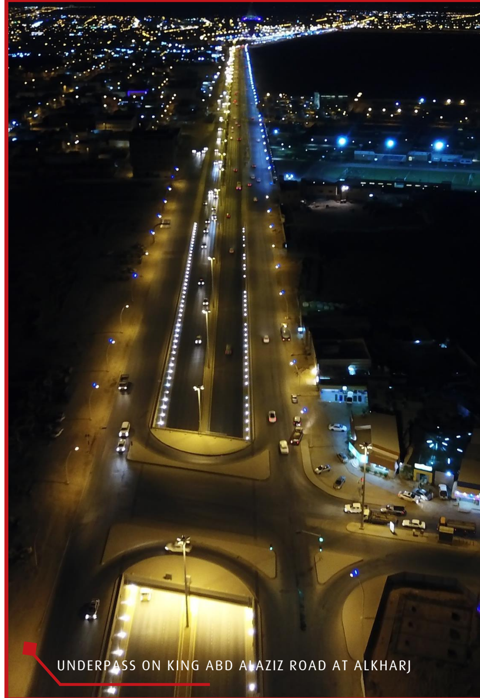
UNDERPASS ON KING ABD ALAZIZ ROAD AT ALKHARJ