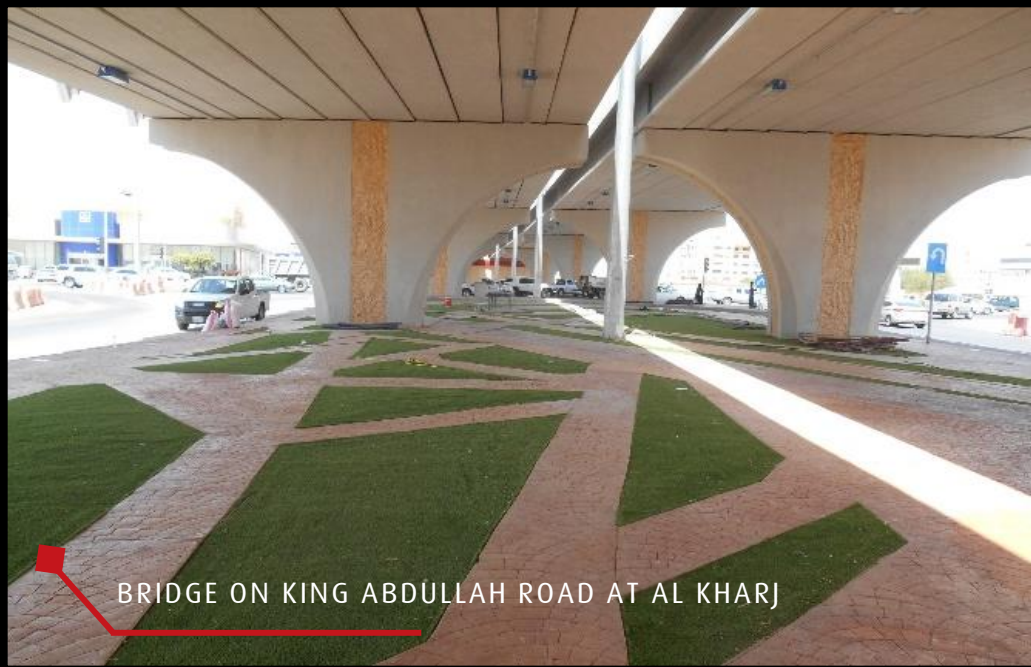
BRIDGE ON KING ABDULLAH ROAD AT AL KHARJ