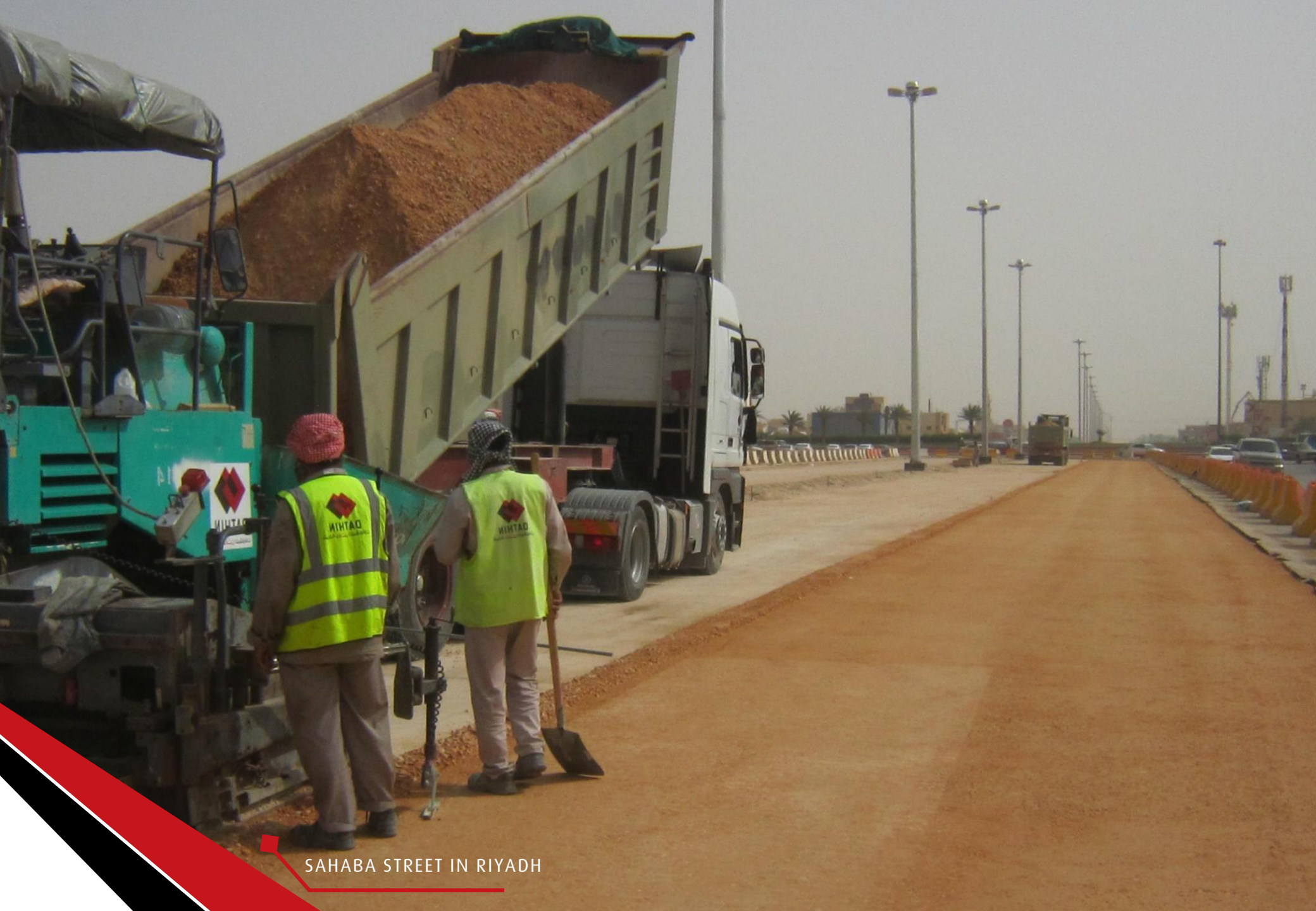
SAHABA STREET IN RIYADH