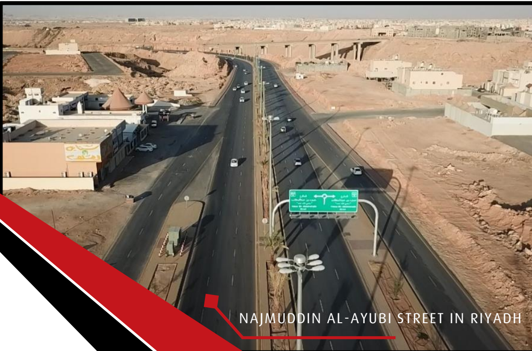
NAJMUDDIN AL-AYUBI STREET IN RIYADH