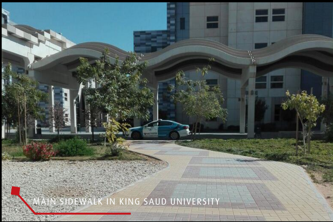
MAIN SIDEWALK IN KING SAUD UNIVERSITY