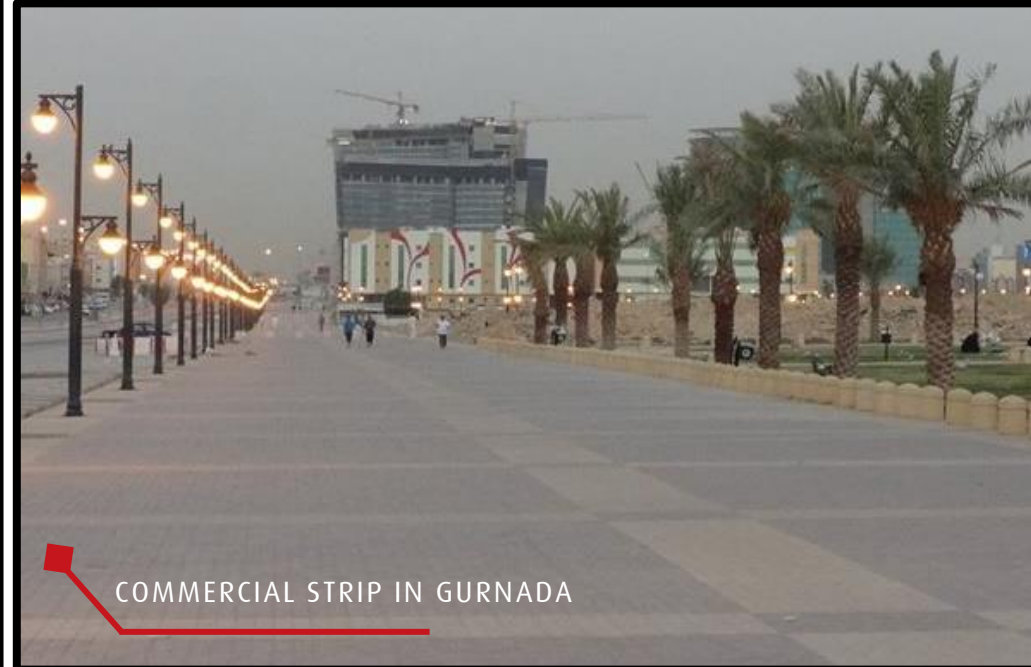
COMMERCIAL STRIP IN GURNADA