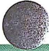
د/ أحمد جميل قطان

تنتهي صلاحية هذه الشهادة بتاريخ : ١٤٤٦/٠٥/١٤ هـ