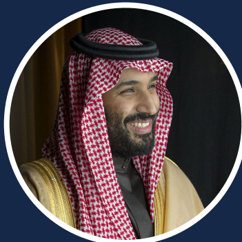
ولي العهد ورئيس مجلس الشؤون الاقتصادية والتنمية محمد بن سلمان بن عبد العزيز آل سعود

٩٩ رؤية 2030 هي مخطط جريء ولكنه قابل للتحقيق لأمة طموحة. إنها تعبر عن أهدافنا وتوقعاتنا طويلة المدى وهي مبنية على نقاط القوة والقدرات الفريدة لبلدنا. إنه يوجه تطلعاتنا نحو مرحلة جديدة من التنمية - لخلق مجتمع نابض بالحياة يمكن لجميع المواطنين فيه تحقيق أحلامهم وآمالهم وطموحاتهم للنجاح في اقتصاد مزدهر.