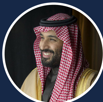
Crown Prince and Chairman of the Council of Economic and Development Affairs Mohammad bin Salman bin Abdulaziz Al-Saud