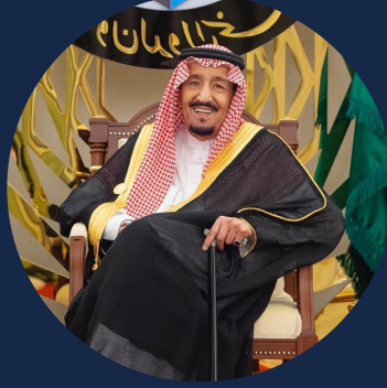
خادم الحرمين الشريفين الملك سلمان بن عبد العزيز آل سعود