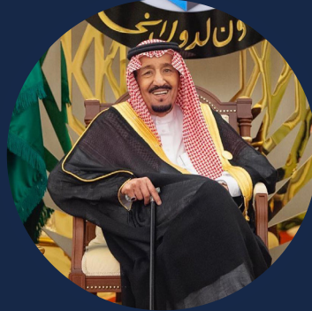
Custodian of the Two Holy Mosques King Salman Bin Abdulaziz Al-Saud